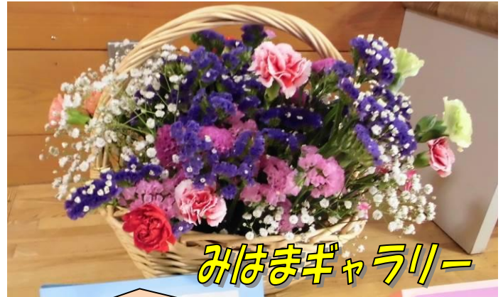
みはまギャラリー

「花育活動」の一環で日高地方でおもに育てている花をたくさんいただきました。1学部の生徒がフラワーアレンジメントをしました。