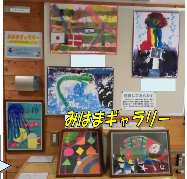
みはまギャラリー

2学部（通学生）・高等部生の作品です。「デカルコマニー」という技法で偶然にできた形や色を利用して制作しています。1学部の生徒（病院入院生）も登校や下校時に鑑賞しています。（一部写真を修正。）